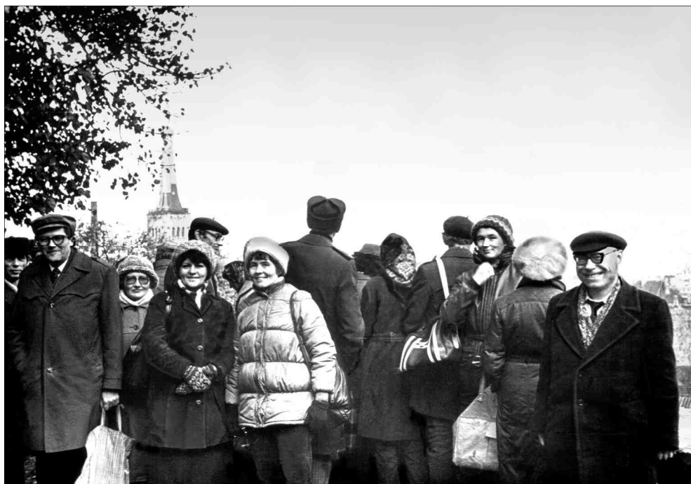
Группа сотрудников ИМЭМО на экскурсии в г. Таллине (Эстония). Начало 80-х гг.

По ходу работы изменились первоначальные хронологические рамки книги (1956—1991 гг.). Очень скоро мне стало ясно, что начинать историю ИМЭМО следует не с 1956-го, когда он был создан, а с 1947 г., когда был закрыт