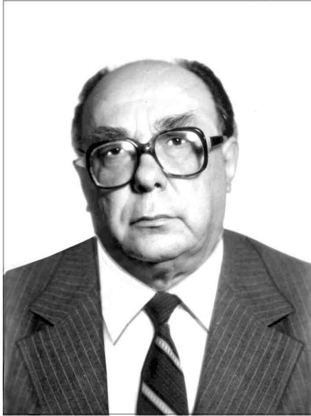
Академик Александр Николаевич Яковлев, директор ИМЭМО в 1983–1985 гг.

Но начиналось все, как я уже сказал, с расчистки наслоений сталинского «идейного» наследия в области экономической науки, определявшего мировоззрение правящей элиты и общества в целом.