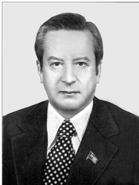
Академик Николай Николаевич Иноземцев, директор ИМЭМО в 1966–1982 гг.

публикациях ИМЭМО и отдавалась некая обязательная дань идеологическим установкам. Но даже это делалось так, что подготовленный читатель получал богатую пищу для собственных размышлений.