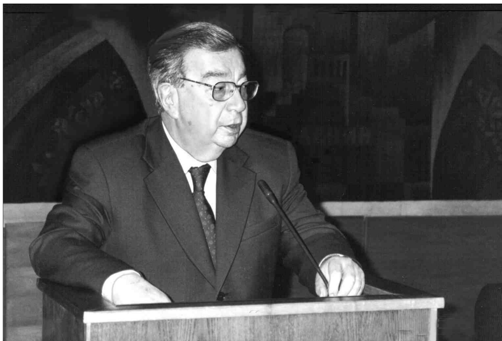
Академик Евгений Максимович Примаков, директор ИМЭМО в 1985–1989 гг.

за становлением других «центров силы» в мировой экономической системе, в частности в Азиатско-Тихоокеанском регионе.