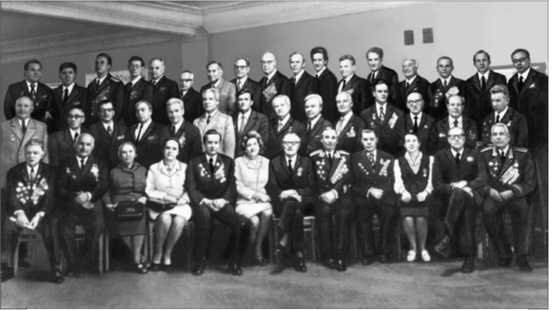
Сотрудники ИМЭМО — участники Великой Отечественной войны в день 25-летия Победы. 9 мая 1970 г.